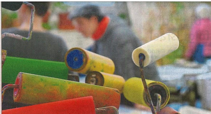
Die Möglichkeiten in der Bildnerischen Werkstatt sind groß. Viele Materialien und „Werkzeuge“ stehen den Künstlern zur Verfügung, um für sich eine ganz eigene Ausdrucksform zu entwickeln.