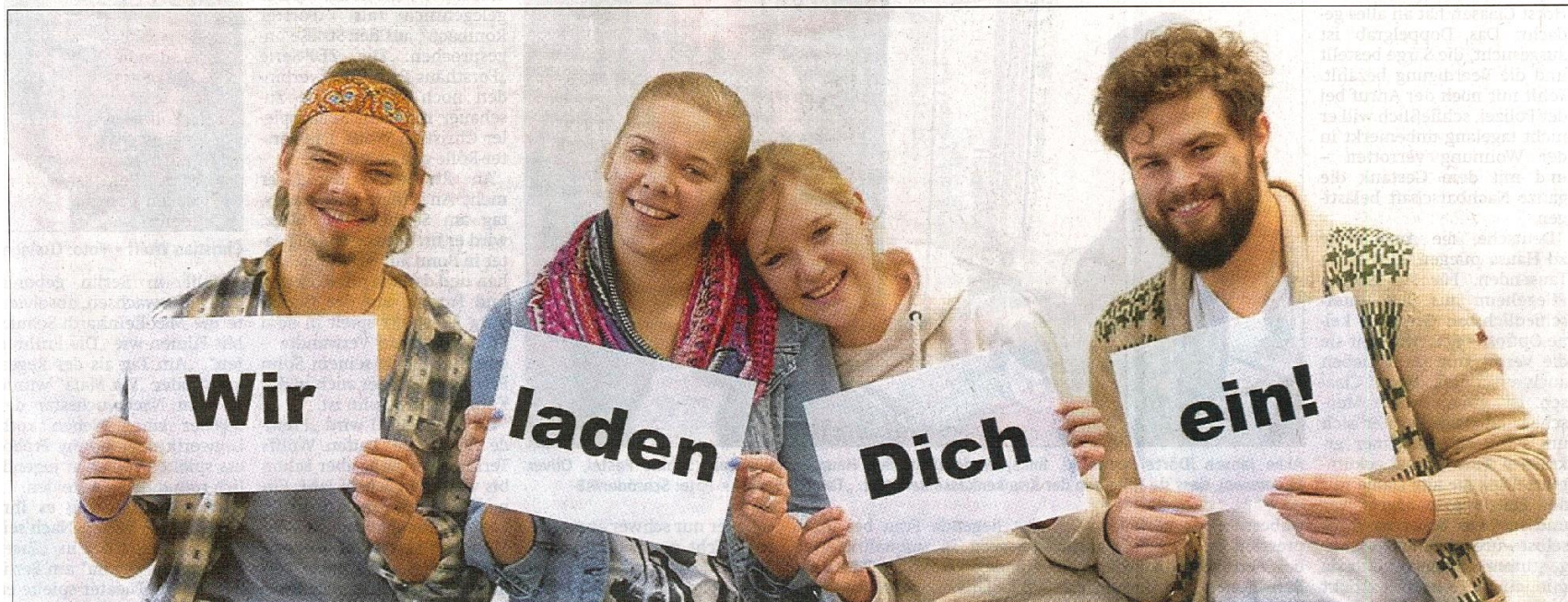
Für alle interessierten Schüler und Jugendliche öffnen die drei Einrichtungen der Diakonie in Rotenburg – Rotenburger Werke, Agaplesion Diakonieklinikum und Mutterhaus – am Mittwoch, 14. März, ihre Pforten von 18 bis 22 Uhr zur „Nacht der Ausbildung“.