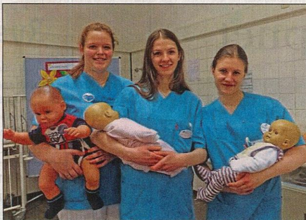
Wissenswertes über den richtigen Umgang mit einem Baby erfahren Besucher im Schulzentrum.

Mit mehr als 4000 Arbeitsplätzen gehören die Rotenburger diakonischen Einrichtungen zu den größten Arbeitgebern in der Region. Neben den pflegerischen Berufen wie Altenpflege, Gesundheits- und Krankenpflege oder Heilerziehungspflege werden auch IT-Fachleute, Erzieher und Kaufleute ausgebildet. Was man genau in den drei Einrichtungen lernen kann, wie die Ausbildung abläuft, wie man sich am besten bewirbt – auf diese Fragen gibt es fachkundige Antworten in der Nacht der Ausbildung. Auch Spaß haben ge-