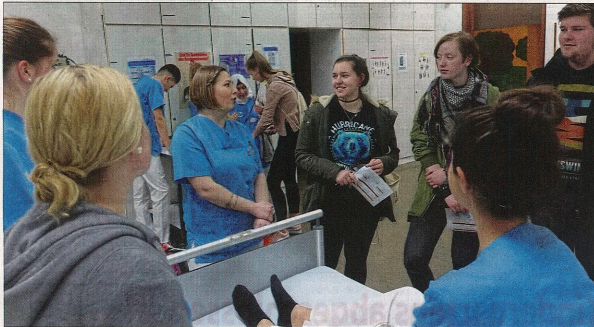
Bei der Nacht der Ausbildung bekommen die Besucher Einblicke in pflegerische Berufe wie Altenpflege, Gesundheits- und Krankenpflege oder Heilerziehungspflege.