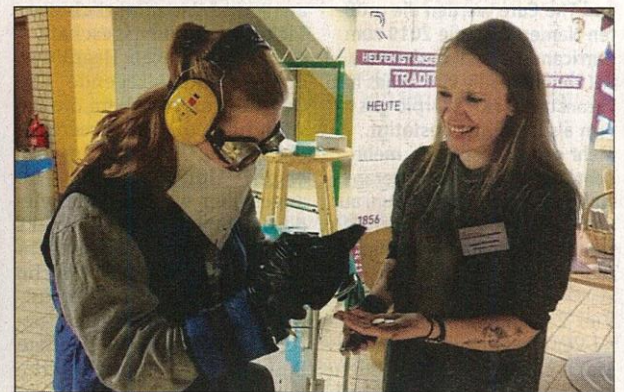
Mit einer speziellen Ausrüstung können altersbedingte Einschränkungen wie schlechtes Sehen und Hören simuliert werden.

Diakonische Einrichtungen präsentieren Vielfalt ihrer Ausbildungsberufe